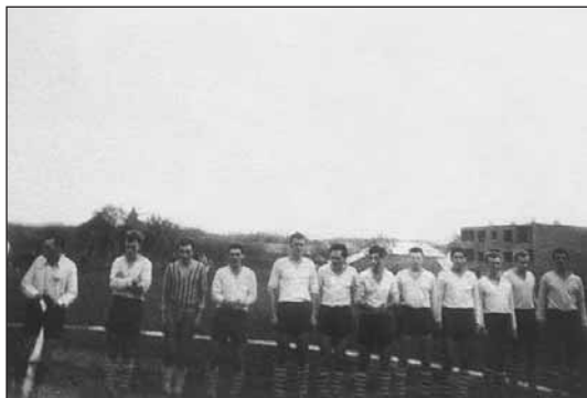
Šesťdesiate roky – spoznávate sa?

obciach Jánošíková, Nové Košariská a Nová Lipnica rozšírený ako nikdy, keď okrem futbalu boli organizované aj kluby celej šírky ľahkej atletiky, cyklistiky, šachu, volejbalu a hádzanej.