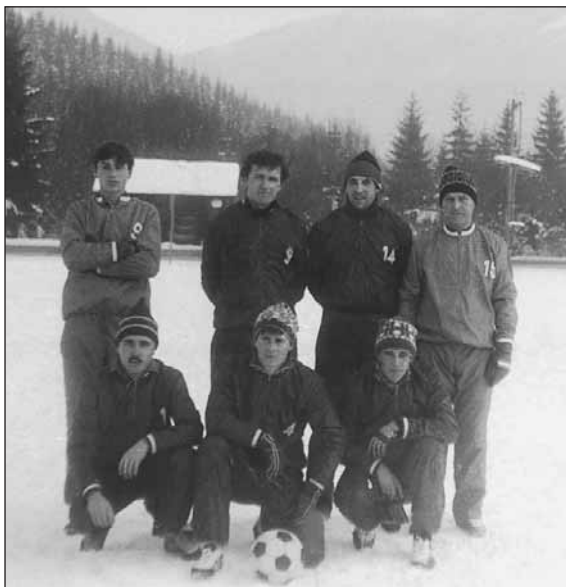
Sústredenie v Terchovej – zima 1985.

Zasluhou aj terajšej starostlivosti o trávnik a okolie, radosť je počúvať častých návštevníkov, že vytvorené podmienky pre futbal u nás by si zaslúžili hrať nie IV. ligu, ale tretiu, ba aj druhú.