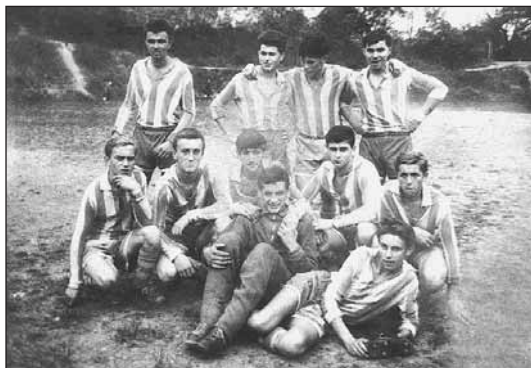
Dorast zo šesťdesiatych rokov

rozmeroch 90 x 45 metrov sa začalo zväčšovať, boli na ihrisku položené troje kofajnice a brigádnicke sa uberala pôda z vrchu ihriska do „ponváglov“ lopatami a vozila sa na druhý koniec smerom k Hanuliakovu, čím sa plocha ihriska zväčšovala nad 50 metrov na šírku, 100 metrov na dĺžku a zároveň sa vyrovnávala.