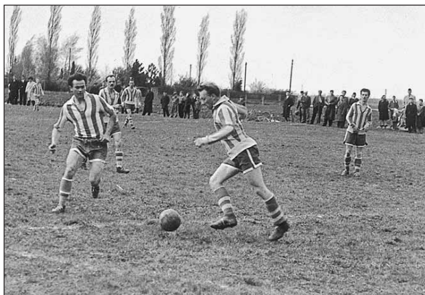
Záber z ihriska v Novej Lipnici zo šesťdesiatych rokov

Súbežne s rozvojom futbalu v tomto období nemohli vystačiť ani futbalové podmienky, najmä samotné ihrisko, ktoré bolo stále ohrozené vodou. Preto po