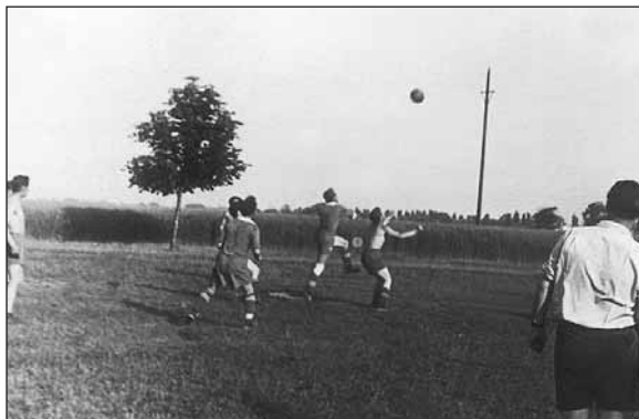
Roky šesťdesiate – ihrisko Lipnica.

Nastupovala jedna akcia za druhou v úprave ihriska v „Jame“.